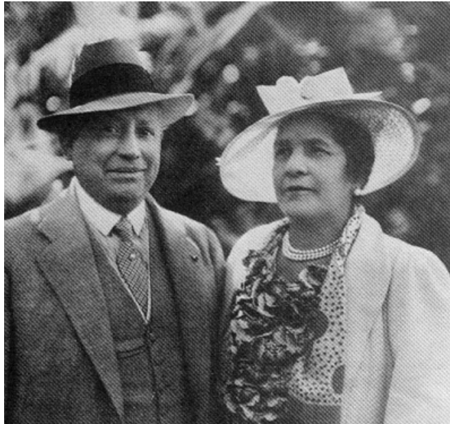
Figura 21-01. Simón I. Patiño y señora Albina Rodríguez

El testamento dijo: "Creemos que hemos cumplido nuestros deberes de padres al habernos esforzado en crear, desarrollar y conservar una fortuna por medio de un trabajo honesto, con rectitud irreprochable... Es y ha sido nuestra línea de conducta emplear el dinero que hemos ganado en el incremento y progreso de nuestras empresas, particularmente las de estaño de nuestro país, cuyos intereses hemos defendido en todo tiempo, ya sea eliminando los peligros de posesión de gran cantidad de acciones por elementos extranjeros o protegiendo su producción por medio de combinaciones internacionales, evitando la competencia que hubiera excluido a Bolivia de los mercados mundiales debido a sus altos costos de producción... El objeto y motivo de esta partición responde a la necesidad de que nuestros herederos entren al manejo y administración de los bienes y negocios... sin que les falte nuestro consejo y que se preserve la legítima aspiración que nos alentó en nuestros esfuerzos de conservar nuestras empresas y agrandarlas en perfecta armonía de acción".