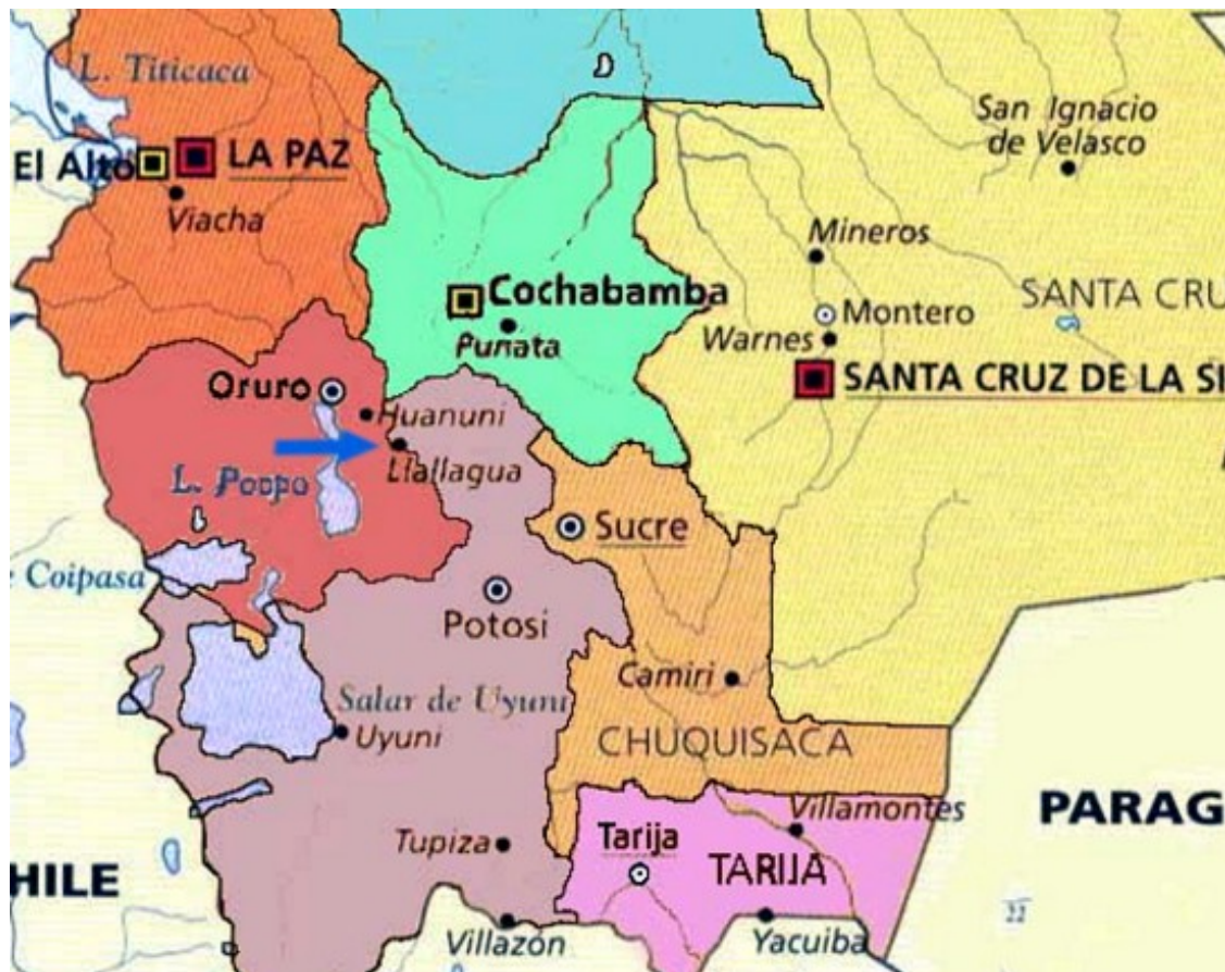
Mapa parcial de Bolivia; la flecha señala el poblado de Llallagua

Por temor a las concentraciones indígenas en la ruta a Viacha se prefirió ir hacia Ayoayo, más al sur. En este pequeño pueblo se encontró a una compañía del Escuadrón Monteagudo (formado también por chuquisaqueños) y un piquete de orureños y cochabambinos. Las tres unidades avanzaron hacia Viacha, escoltando seis carretas cargadas con armas y munición. El coronel Pando, conocedor de este movimiento por aviso de los indios, destacó una fuerza de caballería, que dando un rodeo a Viacha, salió a su encuentro en las proximidades de Cosmini. El combate tuvo lugar el 24 de enero, en el cruce del camino de Ayoayo con el de Luribay (Crucero de Chacoma). Las tropas constitucionales, sorprendidas de frente por las federales y acosadas en los costados por los indios, se defendieron desordenadamente, sufrieron numerosas bajas y se replegaron con dirección a Oruro. Cuatro de las carretas se incendiaron durante el cambio de fuegos y su