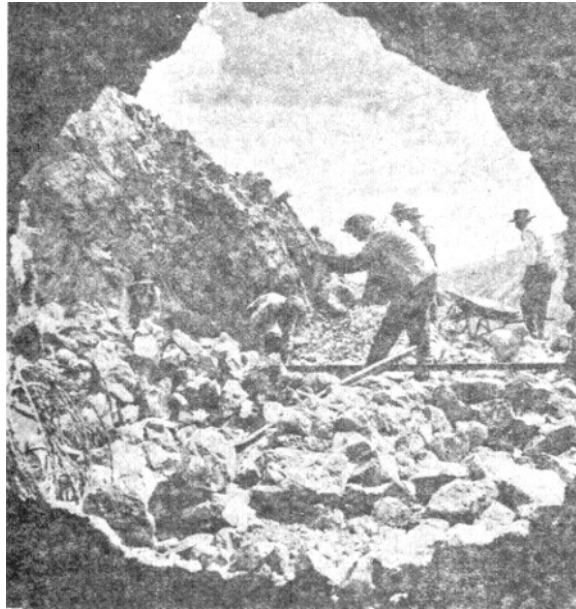
Figura 1. Los primeros esfuerzos

Era un túnel que lo atraía con fascinación irresistible, como llamándole para mostrarle un gran secreto, para entregarle la clave de su destino.